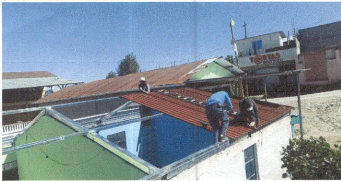
Foto1: Sustitución de lámina por lámina troquelada