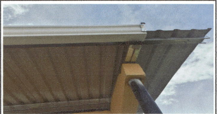
Foto 2 Sustitución de Soporte de Madera, por metal